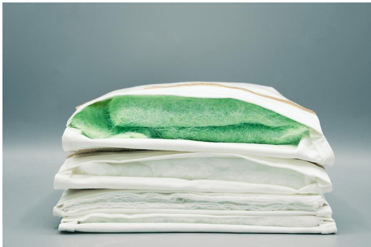
Bild: Verschiedene Aerogel-Vliese. Das grüne Muster ist ein Acryl/Viscose-Aerogel-Vlies, dessen Fasern aufwendig geschnitten und verarbeitet werden müssen. Die weißen Demonstratoren sind Kissen mit 25 x 25 cm mit verschiedenen hochbausichtigen Versionen der biobasierten Zellulose-Aerogele der ITA-Forscher*innen, die direkt als textile Fläche aus der Maschine kommen.

Dem Projektteam ist es gelungen, ein erfolgreiches Verfahren für die „überkritische Trocknung“ der Zellulose Aerogeltextilien zu entwickeln. Damit verfügt ein Gramm des so erzeugten Aerogel-Vlies über eine Material-Oberfläche von ca. 200 qm, das entspricht ungefähr der Größe eines halben Basketball-Feldes. Man kann sich gut vorstellen, dass die Nano-Poren des Zellulose-Materials mit dieser gewaltigen Oberfläche sehr viel isolierende Luft einschließen können. ITA-Projektleiter Maximilian Mohr berichtet, dass die Isolationsleistung von LIGHT LINING mit dem schon angesprochenen Wert von 0,035 W/mK besser ist als das Wärme-Gewichts-Verhältnis von Polyester. Aktuell arbeitet das Wissenschaftsteam an der Hydrophobierung des innovativen Materials und kooperiert eng mit dem Industrie-Partner adidas AG. Inzwischen ist man dabei, verschiedene textile Halbzeuge aus dem Zellulose-Aerogel zu entwickeln – mit guten Ergebnissen. Diese Varianten erweitern den Einsatzbereich für die Sport-, Outdoor- und Modebranche entscheidend. Kein Wunder, dass in absehbarer Zeit eine Ausgründung des Projekts geplant ist, um mit den Erkenntnissen am Markt zu agieren.